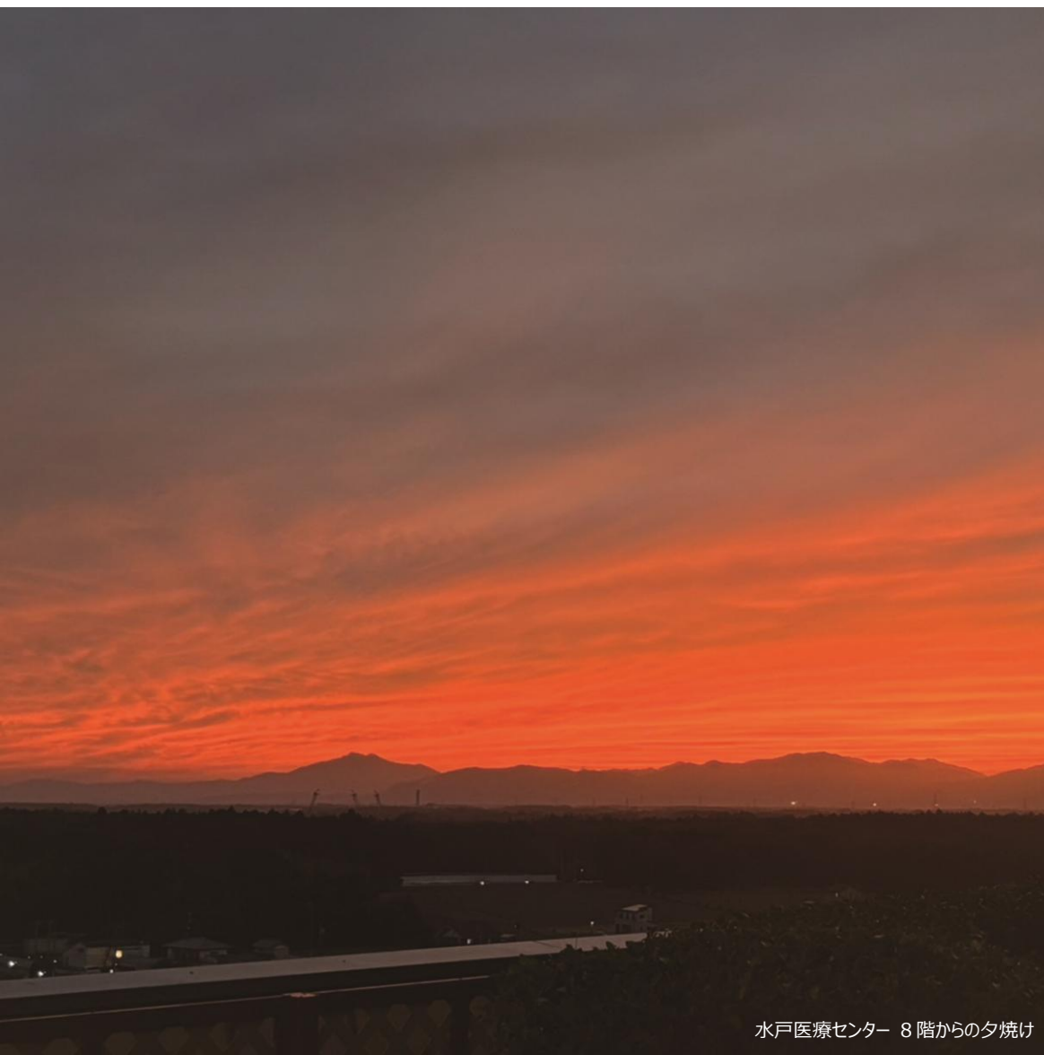
水戸医療センター 8階からの夕焼け