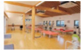
【リハビリテーション室】